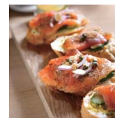
挪威燻鮭蒔蘿三明治 Open Sandwich with Smoked Salmon and Dill