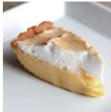
檸檬塔 Lemon Tarte