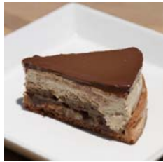
鹽味焦糖咖啡慕斯 Caramel Coffee Mousse