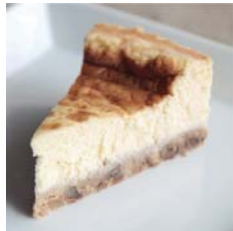
重乳酪蛋糕 Heavy Cheese Cake