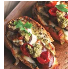
香烤雙茄起士三明治 Roasted Eggplant & Tomato Cheese Sandwich