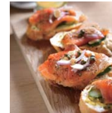
挪威燻鮭蒔蘿三明治 Open Sandwich with Smoked Salmon and Dill

● 酥餅和果醬口味隨機 The flavors of scone and jam are random.