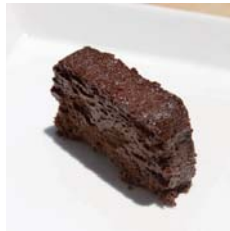
苦甜巧克力嫩薑蛋糕 Ginger Bitter Sweet Chocolate

● 可選杯飲茶款 (冰/熱) Choose the flavor of tea served in cup (Ice / Hot)